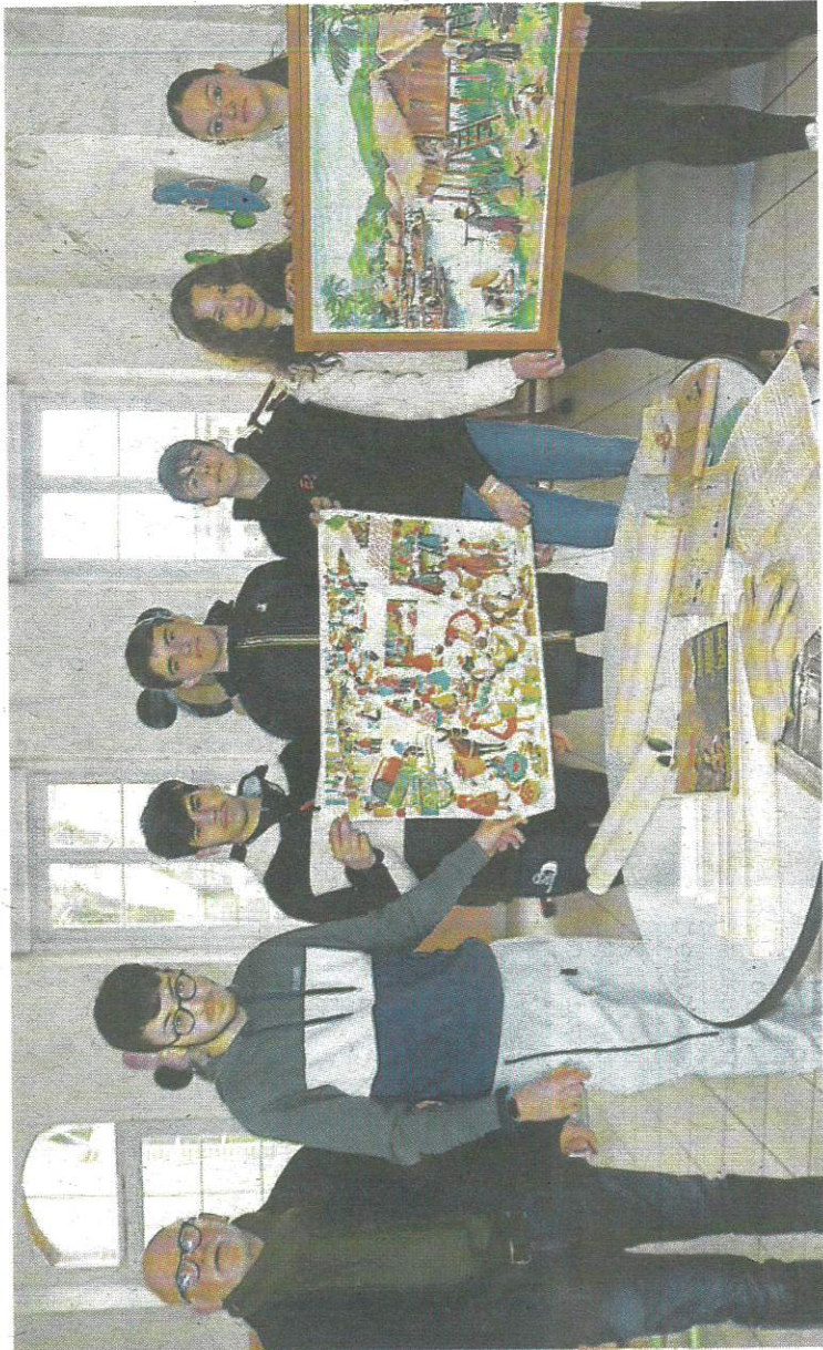
Les adolescents du chantier Argent de poche présentent leurs découvertes dans les greniers de l'école Charles-Perrault de Mayenne.

En juillet 2023, l'établissement ferme ses portes, après plusieurs décennies d'exercice. Sa trentaine d'élèves prendra la direction de l'école de l'Angellerie. Un tel regroupement, ça