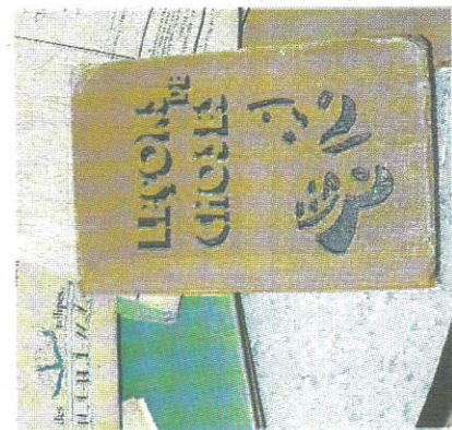
Un livre de Leçons de choses de 1942.

Mayenne ville — Dernière année pour l'école Charles-Perrault. Dans les greniers, six adolescents y ont découvert quelques souvenirs des heures de classe de leurs parents ou grands-parents.