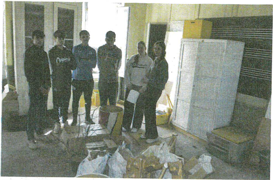
Six jeunes en chantier argent de poche entament le déménagement de l'école maternelle Charles Perrault vers l'Angellerie.