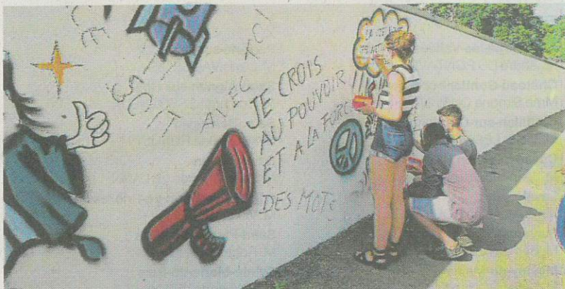
À Mayenne, plusieurs adolescents ont commencé à peindre une fresque place Gambetta.